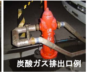
炭酸ガス排出口例

コンパクトな移動式の設備となっていますので機動性抜群。排水処理車で汚れも濁りも漏らさずキャッチして環境にも配慮しています。