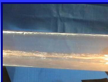
炭酸ガスにより気体と液体の二層流を形成する