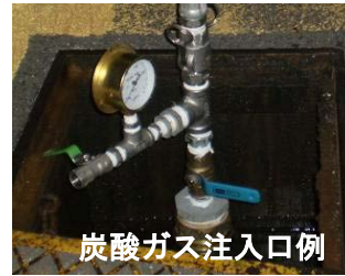
炭酸ガス注入口例