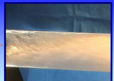
高速水塊流の「せん断力」によって管内を洗浄する