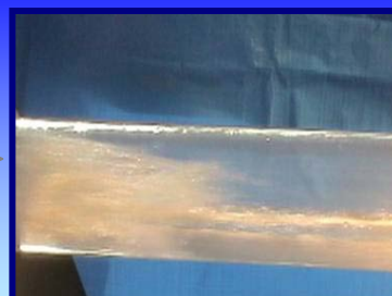
液体が押し出され高速水塊流が起こる